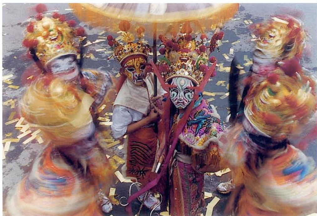
攝影《第一名》 朱清郎 虎威