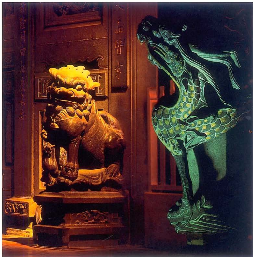
攝影《第一名》卓清倫 守護神