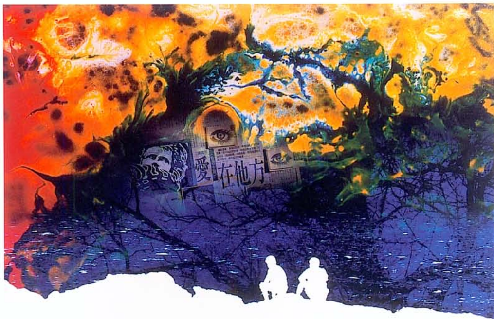
攝影《佳作》 張照煥 戀戀風塵