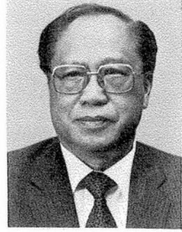
委員兼召集人 秦孝儀先生

字心波，湖南省衡山縣人，民國十年生。上海法學院法律系畢業。美國奧克拉荷馬市大學榮譽人文科學博士。曾任國民黨中央委員會副秘書長。現任國民黨中央委員、中央黨史委員會主任委員、國立故宮博物院管理委員會常務委員兼院長、台灣大學三民主義研究所教授。