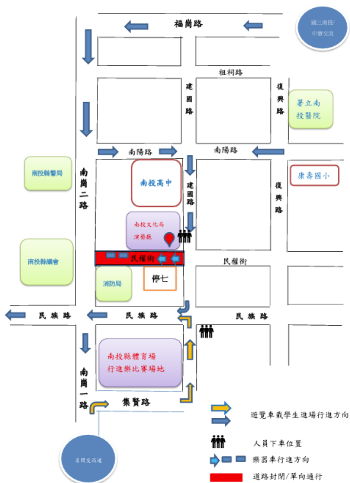
全國音樂比賽中區決賽 文化局 週邊道路及比賽規劃動線(進場)