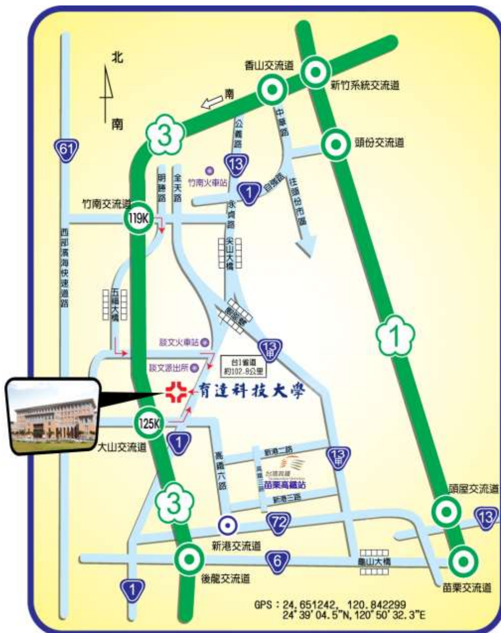
圖 1. 育達科技大學位置及交通路線圖