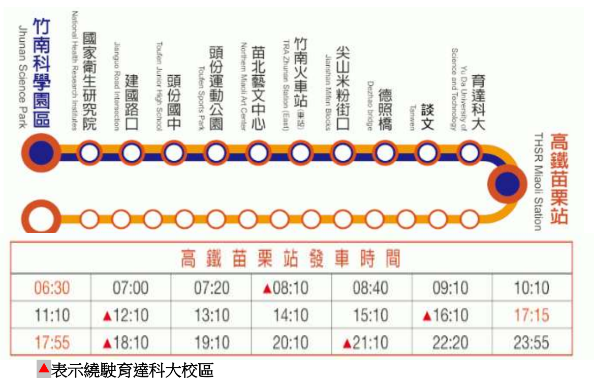
圖 2. 高鐵苗栗站出發時刻表

請搭至高鐵苗栗站後，轉搭乘苗栗客運(5807A 後龍—新竹線)直達校區或搭乘高鐵快捷公車(101A 高鐵苗栗站—竹南科學園區線)於育達科技大學站下車步行入校。高鐵快捷公車自 106 年 12 月 16 日起，往返共計有 10 個班次駛入「育達校區」招呼站停靠。