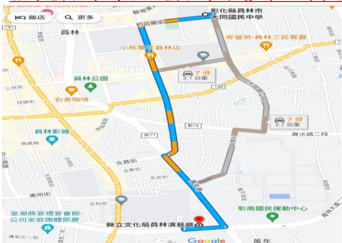
(員林演藝廳路線圖，車程約 7 分鐘)

3. 比賽場地-員林演藝廳有戶外停車場供停車， 若與會人員自行開車至本校，請於場地勘查時間自行開車前往員林演藝廳集合 （詳細路線請見下圖說明）， 請勿搭乘接駁車場勘，接駁車不會再回到本校。