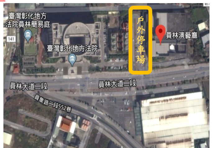
(員林演藝廳停車場)